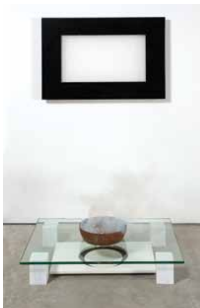
Από την έκθεση ΟΘΟΝΕΣ, 2005 Οθόνη με λιβάνι

Σε χρόνους συντονισμένους στους κύκλους της ημέρας, των εποχών, του έτους, όπου «λειτουργούσε» η κοινότητα με διάφορα «μέσα», όπως: