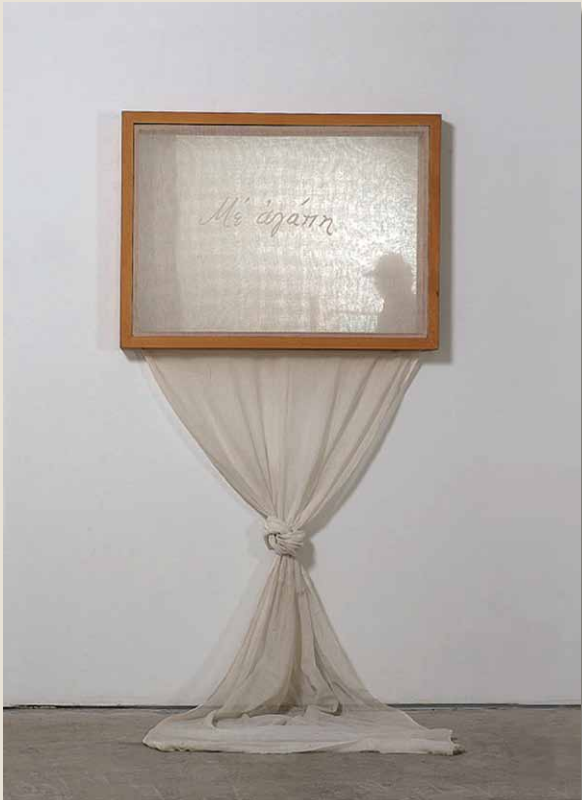
ANTI-ΘΕΑΜΑΤΙΚΑ – «Με αγάπη», 1974