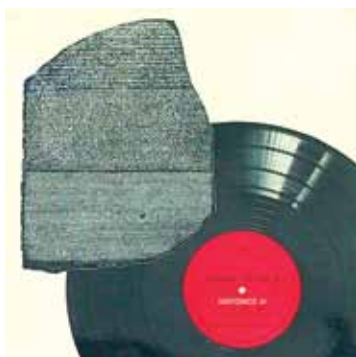
ΧΕΙΡΙΣΜΟΣ ΙΙΙ – Η ΣΤΗΛΗ ΤΗΣ ΡΟΖΕΤΗΣ ΤΟ 1974, έκδοση 1977