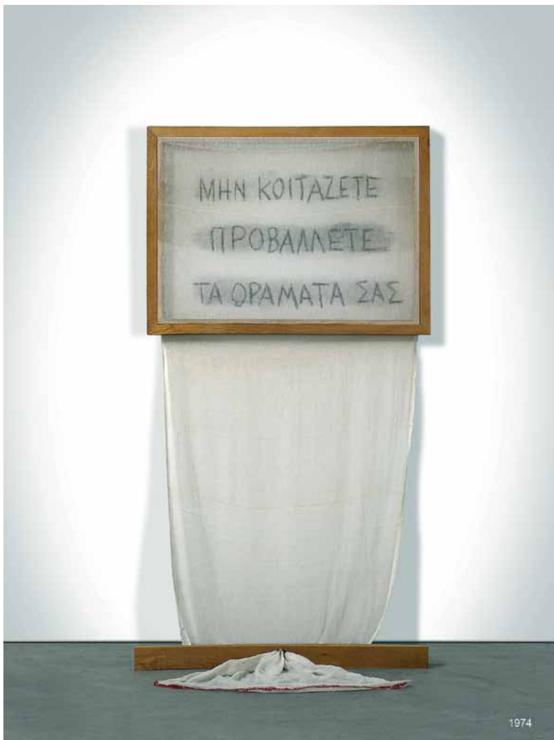
ANTI-ΘΕΑΜΑΤΙΚΑ – «ΜΗΝ ΚΟΙΤΑΖΕΤΕ – ΠΡΟΒΑΛΛΕΤΕ ΤΑ ΟΡΑΜΑΤΑ ΣΑΣ», 1974