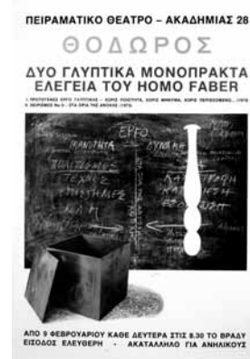
ANTI-ΘΕΑΜΑΤΙΚΟ ΘΕΑΤΡΟ, 1976 Αφίσα