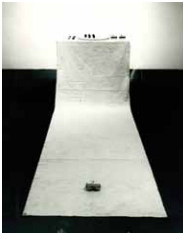
Performance ΓΛΥΠΤΙΚΗ '73 = ΑΦΗ + ΛΙΓΗ ΓΕΥΣΗ