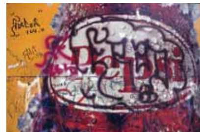
GRAFFITI – Νέα Υόρκη, 1970

Θυμάμαι, εκείνη την περίοδο, και τις θεαματικές καταστροφές πανάκριβων μουσικών οργάνων σε μαζικές rock συναυλίες, ως τελετουργική θυσία της υλικής