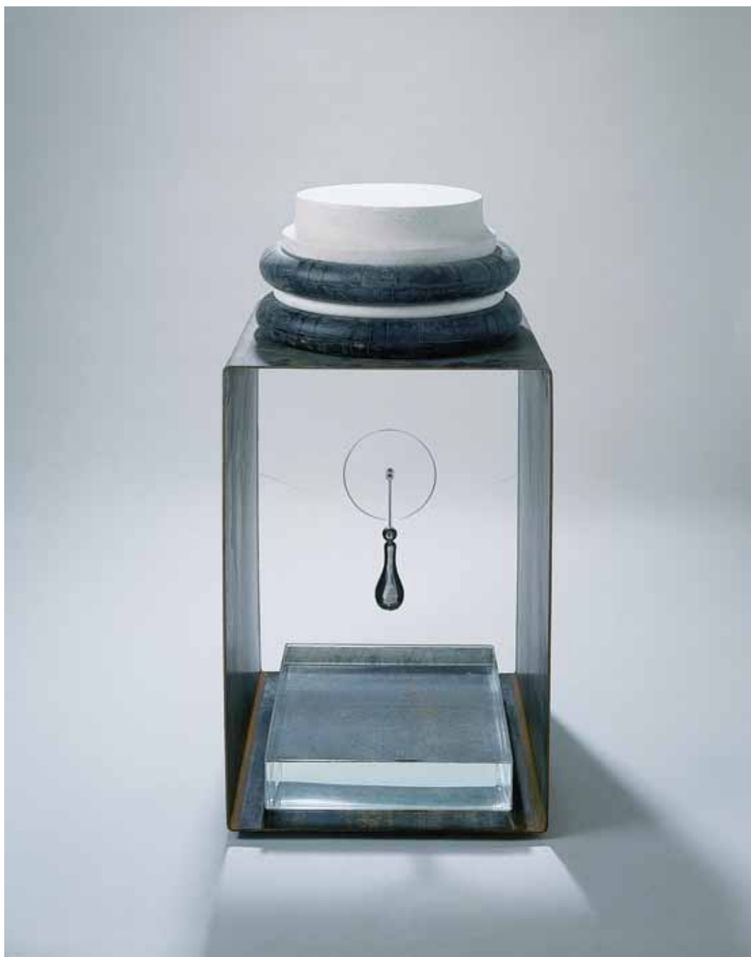
ΚΑΡΥΑΤΙΔΑ Χ, 1994