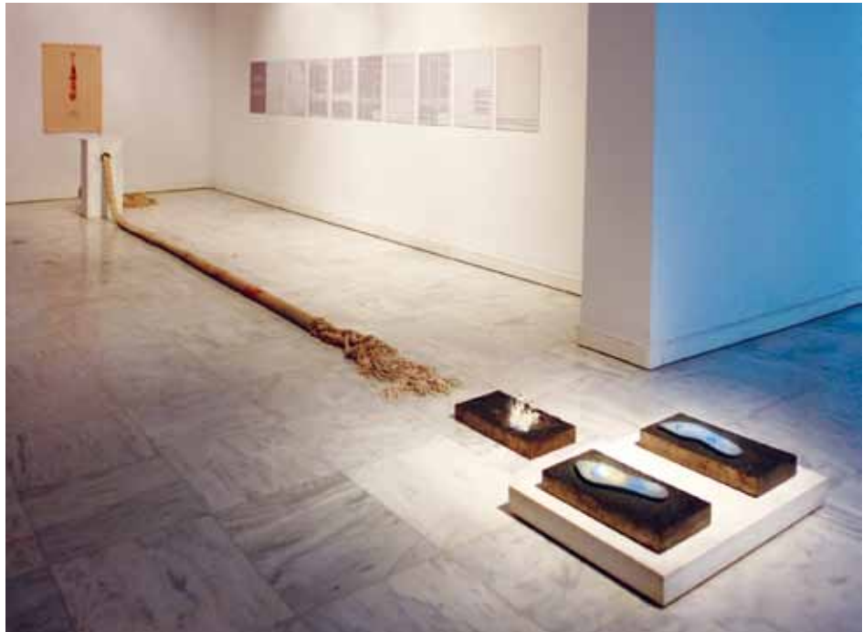
ΑΝΤΙ ΓΙΑ ΕΡΓΟ ΓΛΥΠΤΙΚΗΣ, 1972