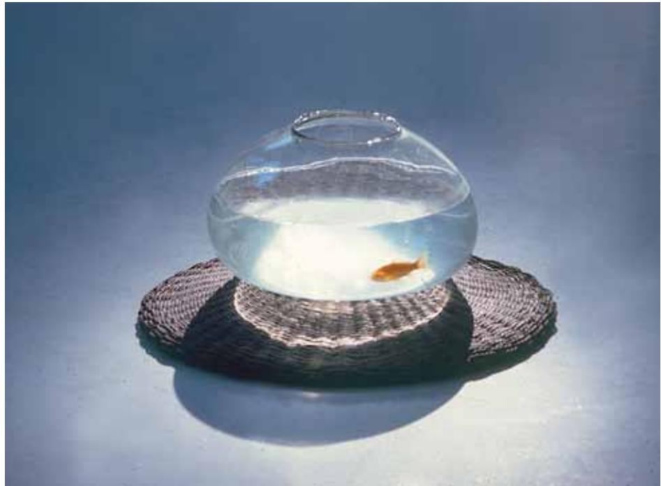
Από την έκθεση ΙΣΟΡΡΟΠΙΕΣ , 1990 Χρυσόψαρο σε γυάλα

Η νεοελληνική κοινωνία, βρίσκεται μπροστά στο μεγάλο δίλημμα: Να πληρώνει τα σωρευτικά χρέη της ραγιάδικης κουτοπονηριάς που σκλαβώνουν