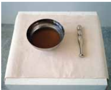
Test N II, γεύση με μέλι