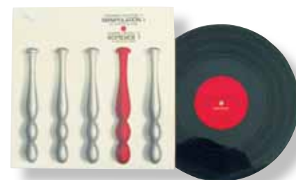
ΧΕΙΡΙΣΜΟΣ I – Για έναν « θεατή » μόνο, 1973