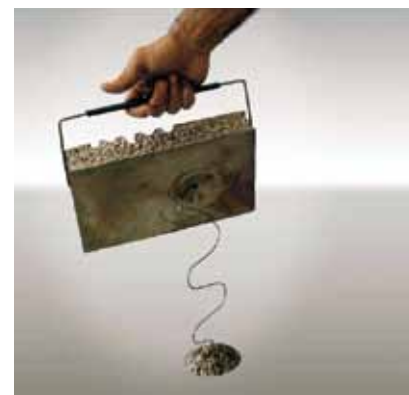
ΒΟΥΒΗ ΦΟΡΗΤΗ ΓΛΥΠΤΙΚΗ, 1969